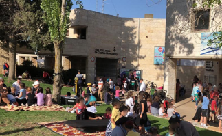
פעילויות חוץ ברקנטי 6 וברחבי השכונה.

וכבר עד כה הופעלו למעלה מ-8 תוכניות שונות עבור המשפחות הצעירות (כגון: מעגלי תמיכה לאימהות לקראת לידה, מעגלי תמיכה לאימהות ותינוקות לאחר