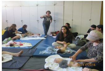
פעילות לאמהות ותינוקות בחופשת לידה.

פרויקט "שכונה צעירה" הוקם בשנת 2011 על ידי רשות הצעירים העירונית בעיריית ירושלים, במטרה להפוך מספר שכונות נבחרות בירושלים לאטרקטיביות