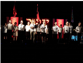
טקס יום הזיכרון לחללי צה"ל בהובלת נוער רמות

ואני שואלת כנערה שהתחנכה בבית הספר ובתנועת הנוער בשכונה: איך שוכחים את הנוער? את כוחו הגדול? את היוזמות המבורכות את הפעילות? איך שוכחים את החינוך