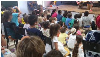
הצגות והפעלות אחה"צ לילדים.

בבסיס פעילות הפרויקט עומדת התפיסה שהקהילה והמרחב מקיימים ביניהם קשרי גומלין, ושקהילה חזקה, פעילה ומאוחדת מייצרת מרחב איכותי ונעים. משום כך פועל רכז הפרויקט באופן שוטף וקבוע לחיזוק הקשרים בין תושבי השכונה, לחיבור התושבים לתהליכים שקורים בתחומים השונים, וכן לפעול יחד עם תושבים לשינוי ולקידום נושאים, פרויקטים ומהלכים המשפיעים על אופי השכונה. בפשטות – הפרויקט